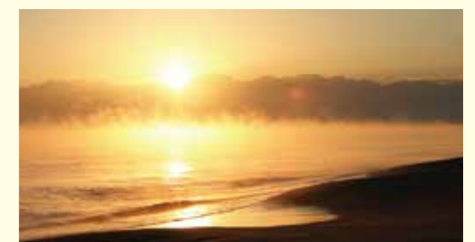
気風…海、湖などの水面から湯気のように霧が立ち上る現象

氷見海岸一帯からは 3,000m 級の立山連峰が富山湾に浮かぶように見えます。この景色は、年間 50 日ほどしか見れない貴重な絶景ですが、朝日もまた幻想的で美しい光景です。氷見の宿で朝とれ新鮮な魚を味わって泊まったら、ちょっと早起きして朝日を眺めて見ませんか。