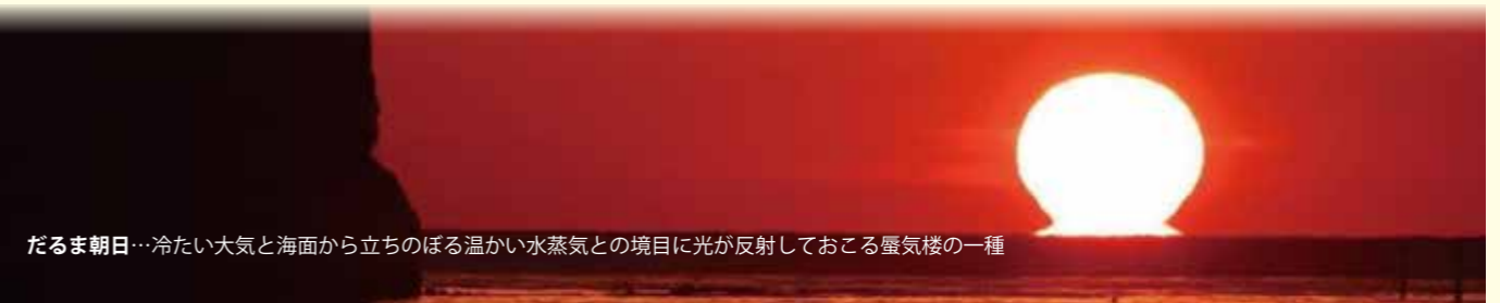
だるま朝日…冷たい大気と海面から立ちのぼる暖かい水蒸気との境目に光が反射しておこる蜃気楼の一種